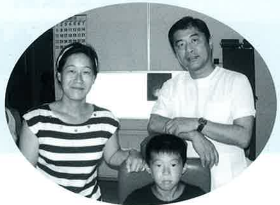
【健診に訪れた子供達 2】