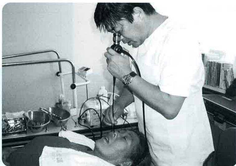
【舩倉島での健診風景】

舩倉島ではもともと男女の喫煙率が高い土地柄であり、20年前に比べ近年では、耳からのどへと診療の力点を移しているそうです。最近では、咽喉ファイバースコープを用いた検査が副鼻腔X線検査やオーディオメーターとともに不可欠となっているとのこと。