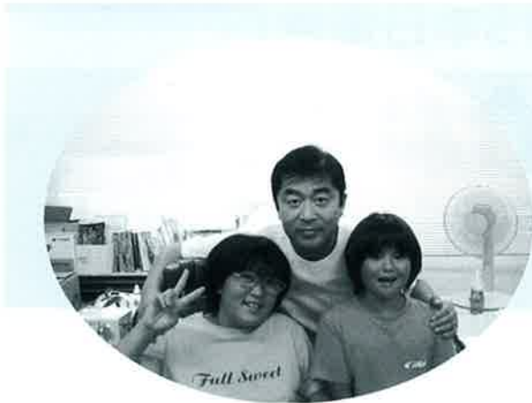
【健診に訪れた子供達 1】